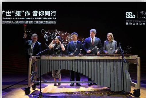
▲ 捷豹品牌冠名上海交响乐团音乐厅战略合作启动仪式 重磅举行

通过与中国最顶级的音乐品牌建立长期的商业合作伙伴关系，联合上海交响乐团和捷豹上海交响音乐厅 (JSSH) 的IP进行品牌营销，不仅能让企业接触并影响到共同的目标受众，还能通过量身定制的营销方案帮助企业全方位地扩大品牌影响力和认知度，并与目标客户积极互动。